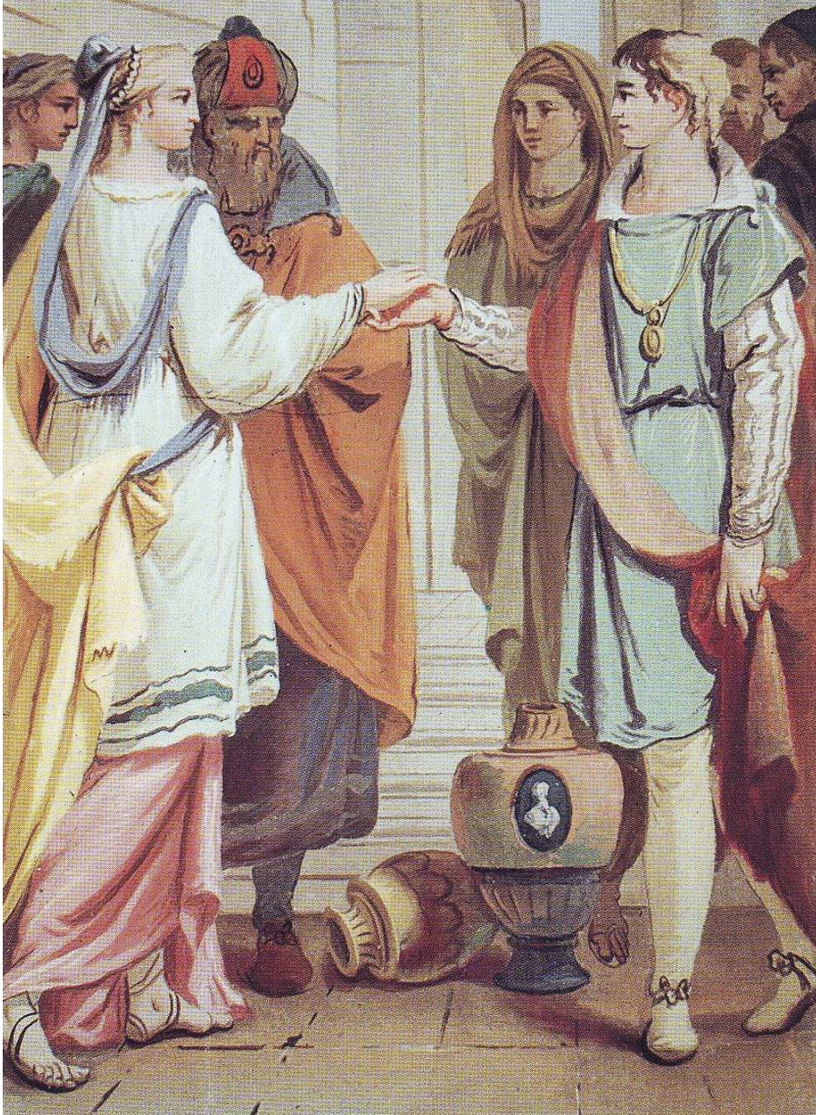
Il matrimonio ebraico