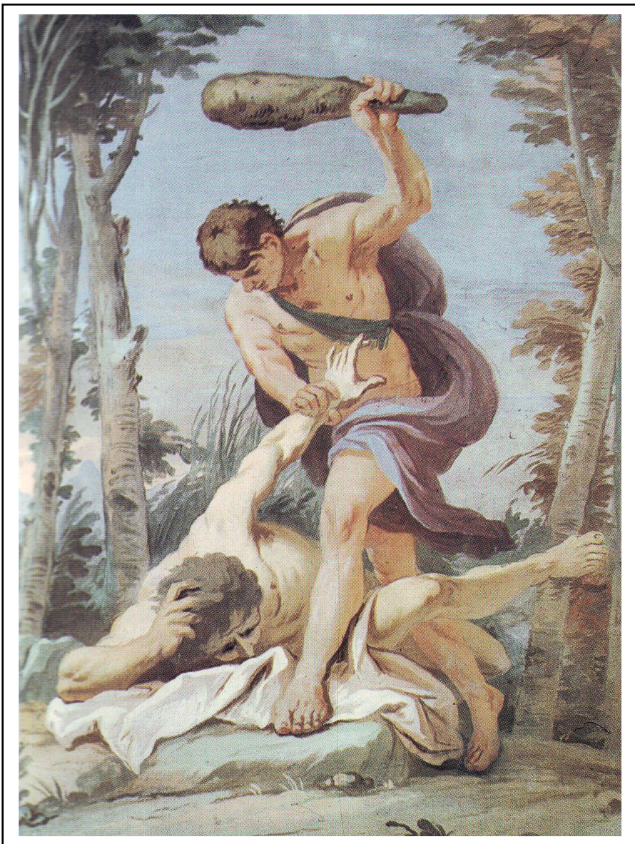
DAL LIBRO DELLA GENESI “Caino e Abele”