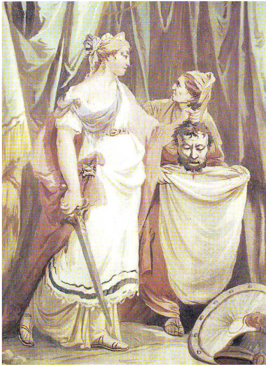
DAL LIBRO DI GIUDITTA “Decapitazione di Oloferne”